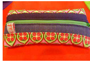
Les étuis à lunettes à 28€