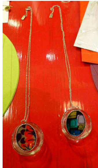
Les sautoirs à 40€