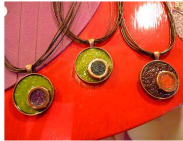
Les colliers sertis à 38€