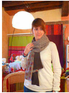
Les foulards Kach'Kol (collection Femmes et collection Mixte) à 45€