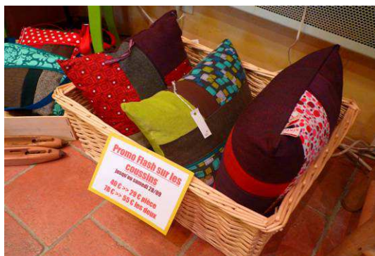
PROMO FLASH sur les coussins